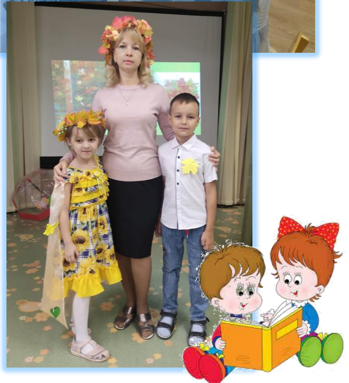
Участие в конкурсе мелодекламаций «Осенняя мозаика»