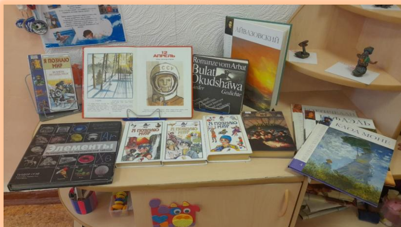
Выставка энциклопедий, организованная с помощью родителей