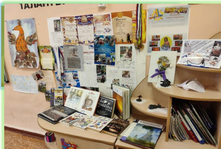
Выставка, организованная с помощью родителей «Я – талантлив»