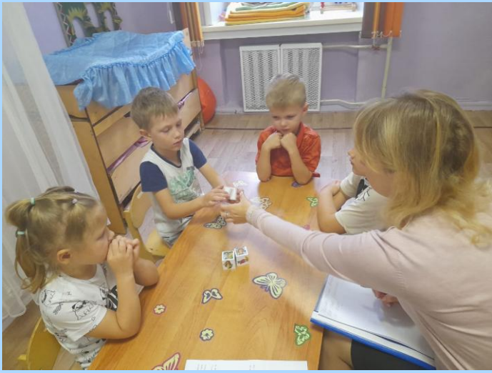
Сочинение сказок «Прогулка в осеннем лесу» в игровой форме по технологии «Сторителлинг»