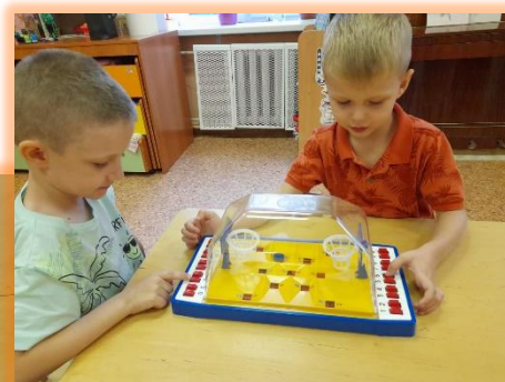
Совместное участие в настольных играх: «Мемо», «Домино», «Баскетбол» и т.д.