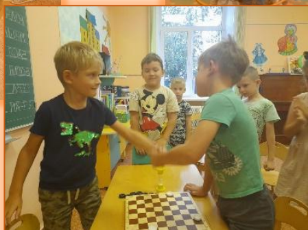
Турнир по шашкам