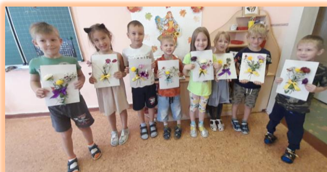
Творческая работа по составлению букетов из осенних цветов «Я - флорист»